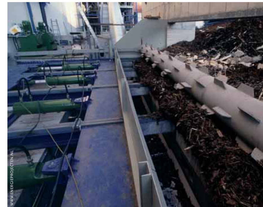
In het Oostenrijkse Klagenfurt worden houtsnippers afkomstig van lokale houtfabrieken verbrand voor de opwekking van energie.